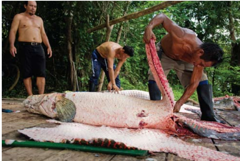
Arriba: Los fileteadores son expertos en retirar las vísceras y las espaldas del pescado. Abajo: La cabeza del paiche es el único manjar que comen los pescadores. Página opuesta, arriba: Los pescadores desayunan y almuerzan en la laguna mientras dura la pesca.