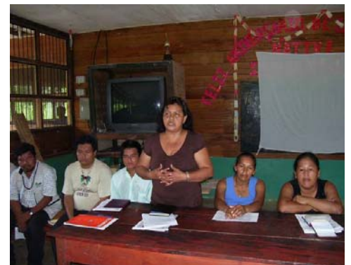
Comunidades Indígenas mejor informadas.