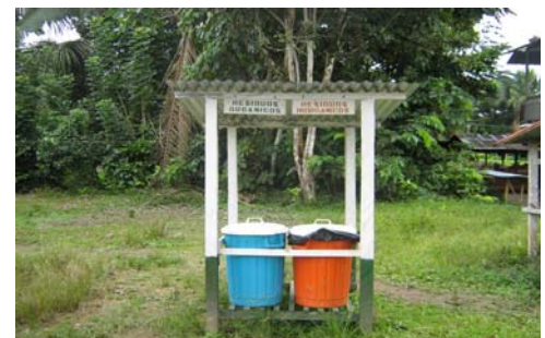
Iniciativas para mejorar la gestión ambiental