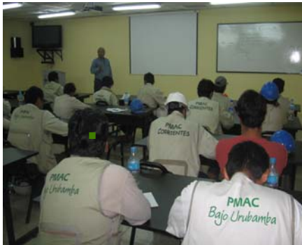
Capacitación a Monitores.